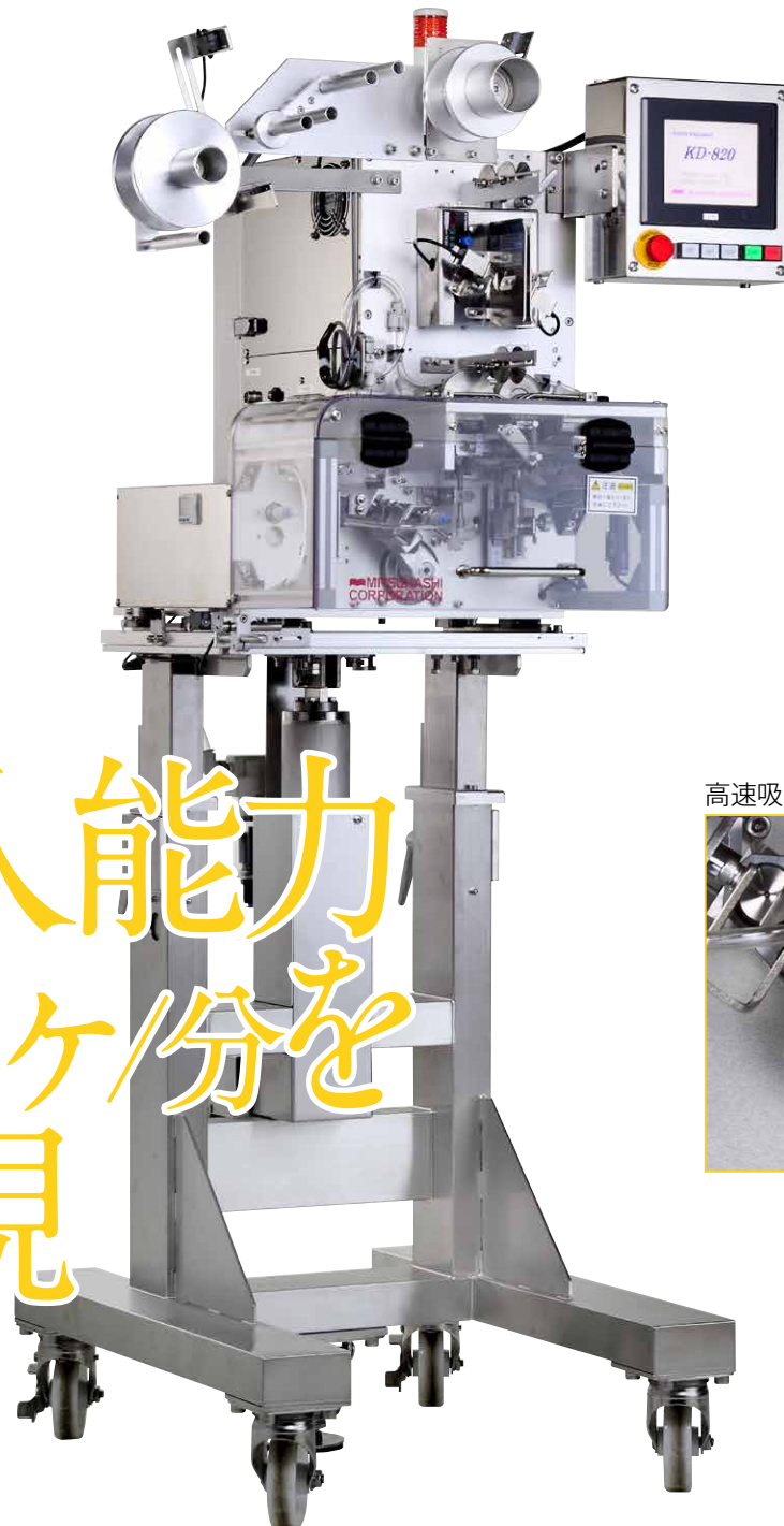
高速吸着ユニット LV-200-L 型を搭載